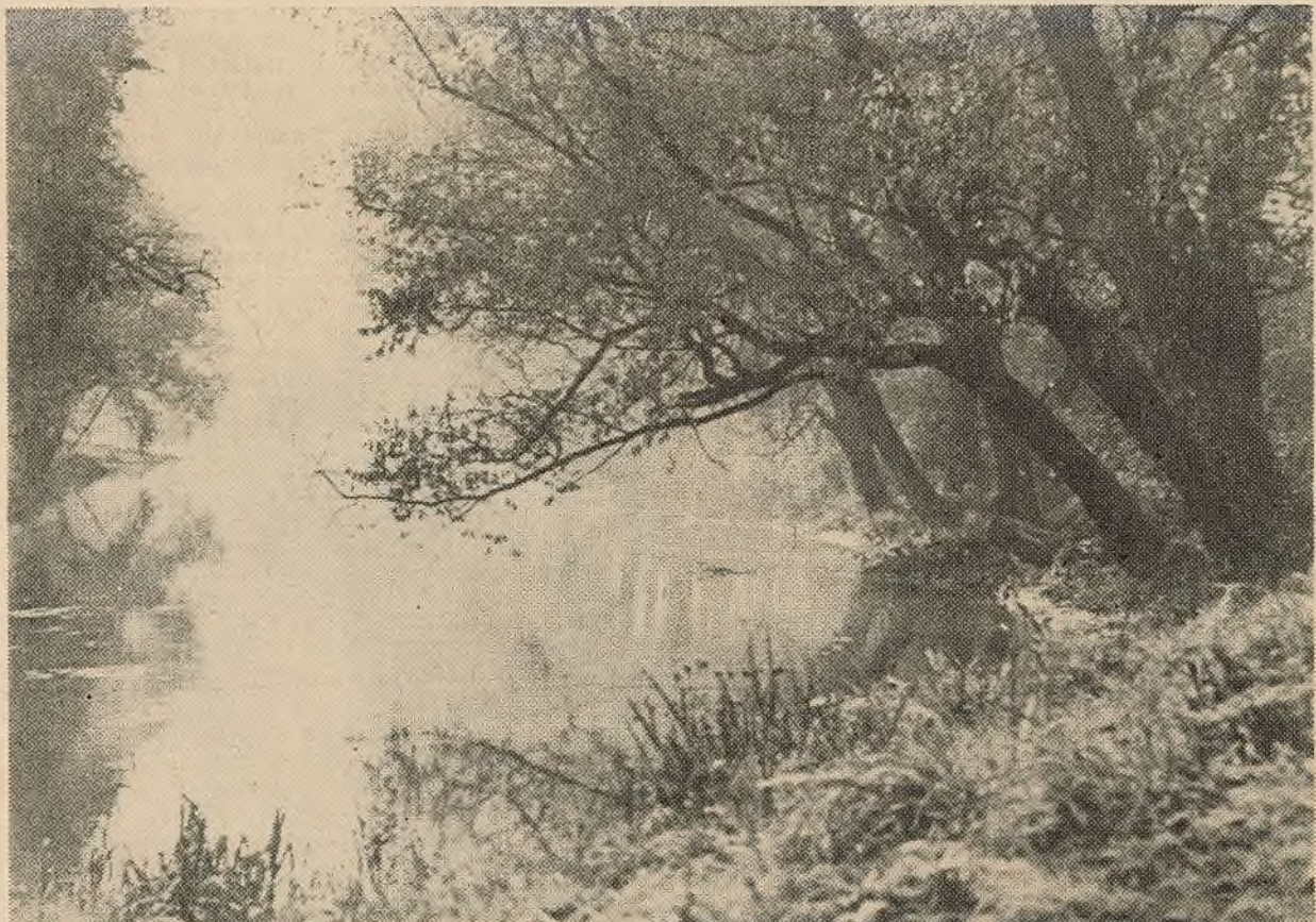
Над Свіслаччу.